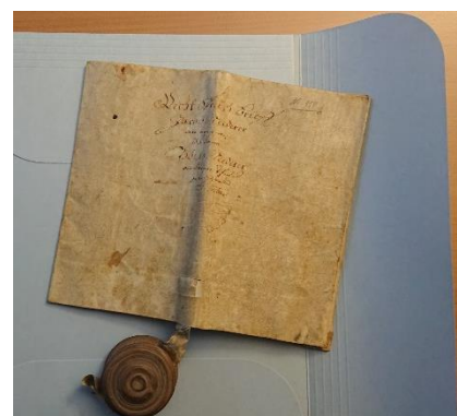
6 Inspektionsberichte Zivilstandsamt Herisau 7 Vor der Erschliessungsarbeit, LdU Archiv SG 8 Gerda Leipold bei der Ausstellungsvorbereitung ZKB 9 Königsurkunde mit Siegel in Holzkapsel, Gemeindearchiv Lutzenberg